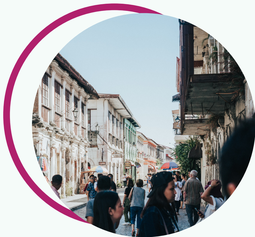
CONSULTATION SUR 8 LIEUX DE L'AGGLOMÉRATION