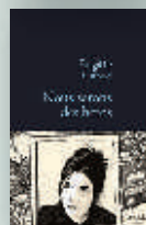
Nous serons des héros, Brigitte Giraud, Stock, 2015