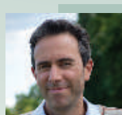
14h45-15h15 François Darracq Splendor Veritatis Slatkine