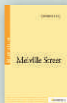
Melville Street, Xavier Deville, Sulliver, 2015

Dialogue animé par Yann Nicol, journaliste littéraire