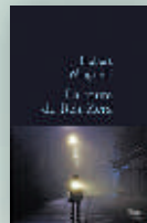
La route de Beit Zera, Hubert Mingarelli, Stock, 2015