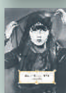
Archives du vent, Pierre Cendors, Le Tripode, 2015