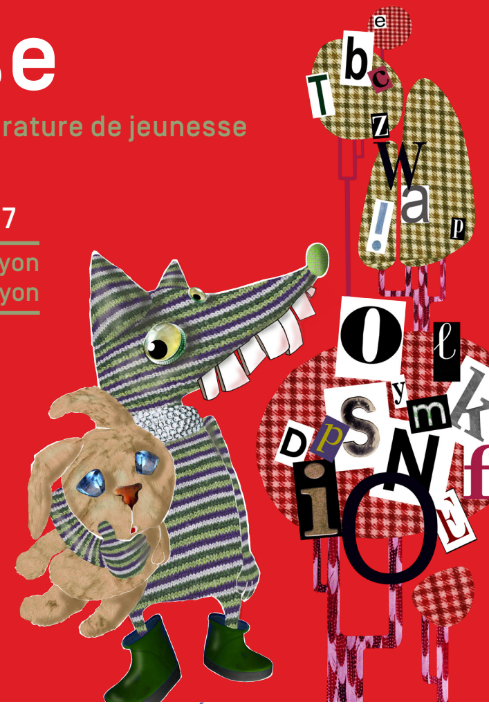
Illustration © Sandrine Domaine