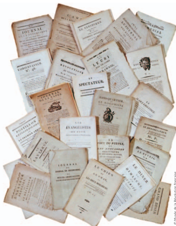
Périodiques : lot de journaux de la période révolutionnaire - n° inv. L.1988-353

* Créé en 1983 par le Conseil général, le Musée de la Révolution française est installé dans le château où se tint, en juillet 1791, l'assemblée des trois ordres du Dauphiné, prélude aux événements révolutionnaires.