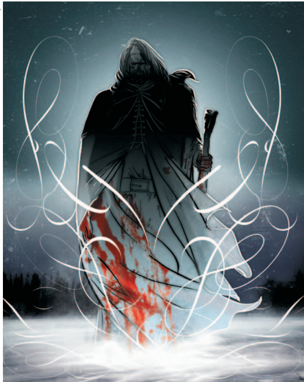
Frankenstein vu par Sébastien Hayez, en couverture des Nombreuses Vies de Frankenstein , d'André-François Ruaud. À découvrir, la "Bibliothèque rouge", collection phare de l'éditeur lyonnais Les Moutons électriques. (lire p.6)