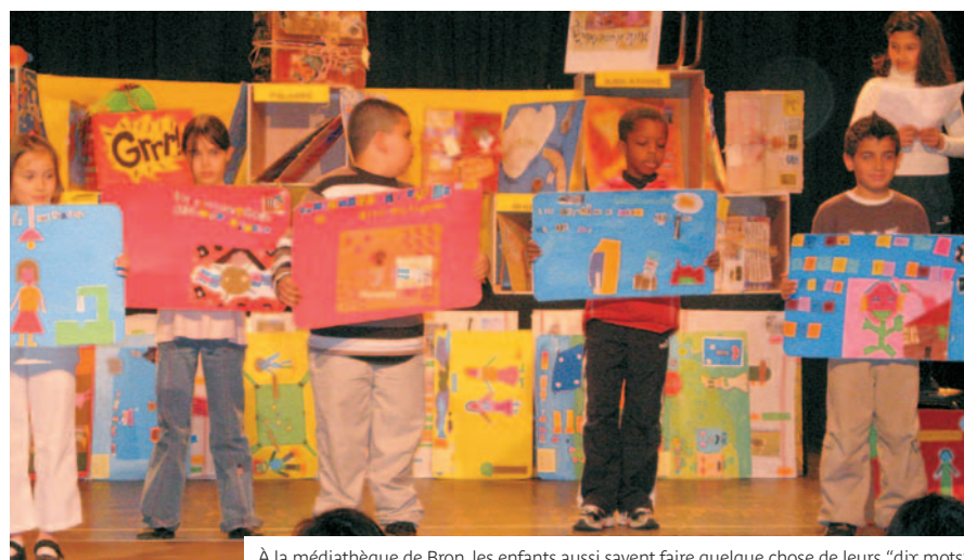
À la médiathèque de Bron, les enfants aussi savent faire quelque chose de leurs "dix mots"

Arpenteurs, les participants sont invités cette année à évoquer le thème de l'avenir en réalisant un livre-objet au sein d'ateliers d'écriture, arts plastiques, mise en voix.