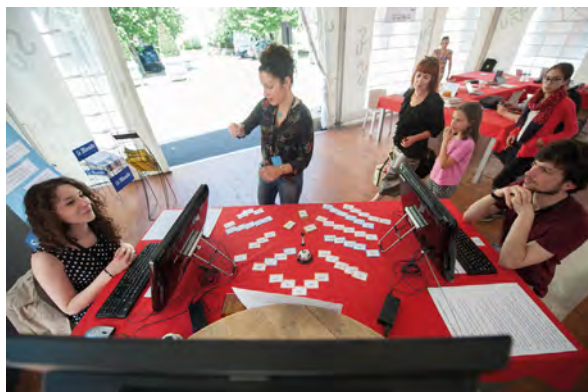
Battle du Petit fablab d'écriture

« Après une première expérience dans l'édition, je m'oriente vers le service public de la lecture en tant que bibliothécaire, puis conservateur. En 2009, je me forme à l'animation d'ateliers d'écriture et propose des ateliers et des stages en bibliothèque, à l'université. En 2016, je crée une autoentreprise pour développer cette activité de formation à l'écriture. Je publie en revues ( Soleil et Cendre , Bacchanales ) et en recueil collectif ( J'ai payé pour ça ? , La Passe du vent , 2009). De si petites ailes , mon premier recueil de nouvelles et de fragments, paraît aux Éditions Sur Le Fil en 2017. »