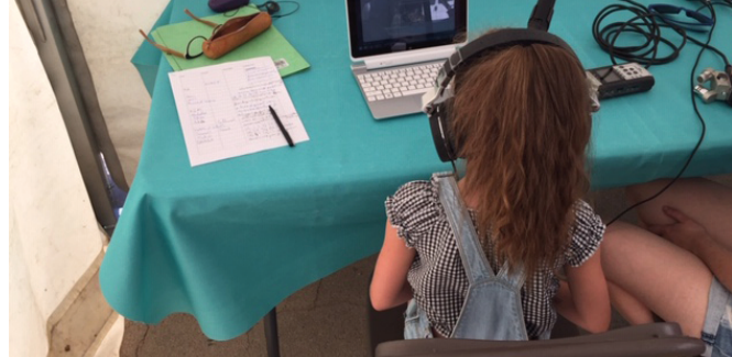
Petit fablab d'écriture, Livrodrome 2019