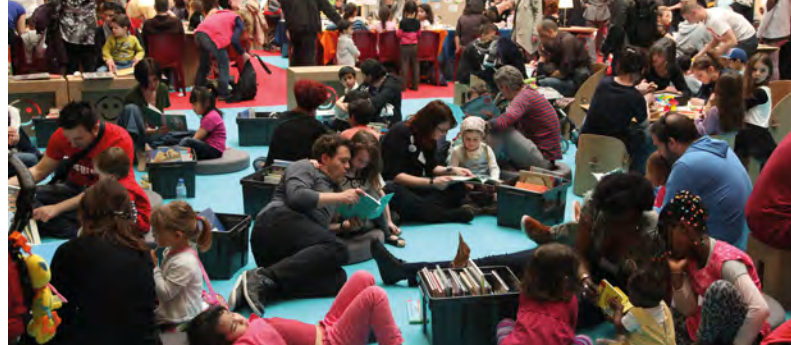
Assis, debout, couché, on lit !, espace lecture des médiathèques